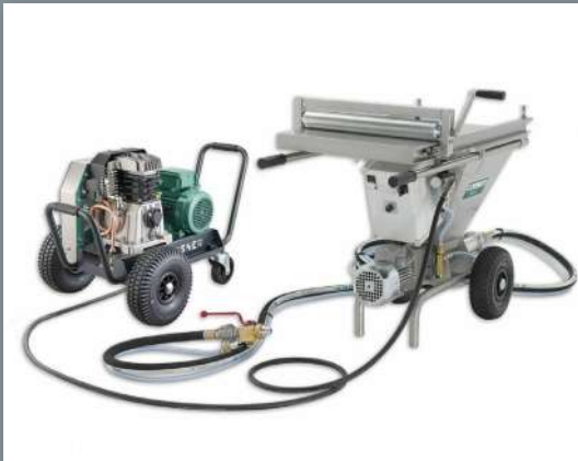
Machine à goutelettes Kosner