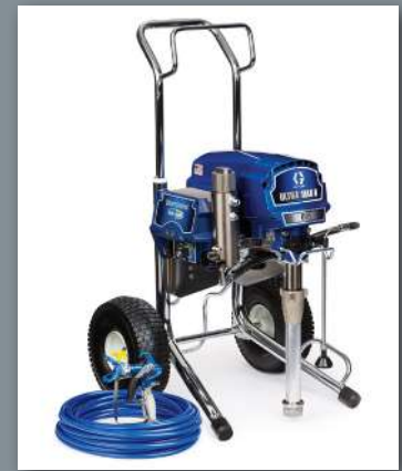
Pistolet peinture Airless